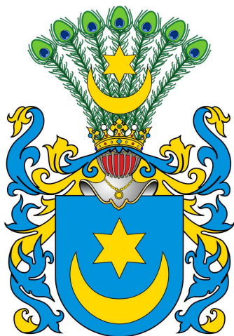
Bernatowiczowie h. Leliwa

1686 ↓ 1707 ↓ 1702 - 1709 ↓ 1783 ↓ 1845 ↓ 1860